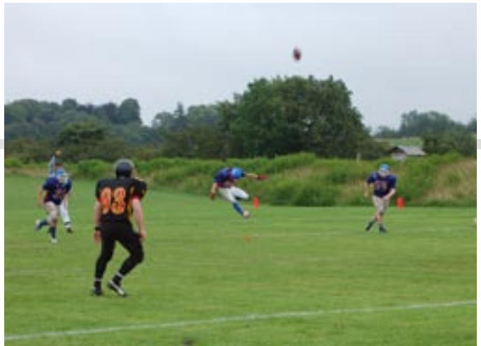
Kolding Guardians på hjemmebane mod Herning Hawks (2007)

Returner – Returnerens opgave er at modtage bolden på et kick-off eller punt, hvor efter han skal forsøge at bringe bolden så langt ned af banen som muligt. Hvis det lykkes returneren at løbe bolden helt ned i end zonen, score han et touch down.