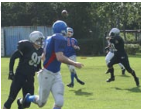
Kolding Guardians på udebane mod Avedøre Monarchs (2007)

Hele meningen med galskaben, er at flytte den lille ovale bold over modstanderens mållinje og derved score touchdown.