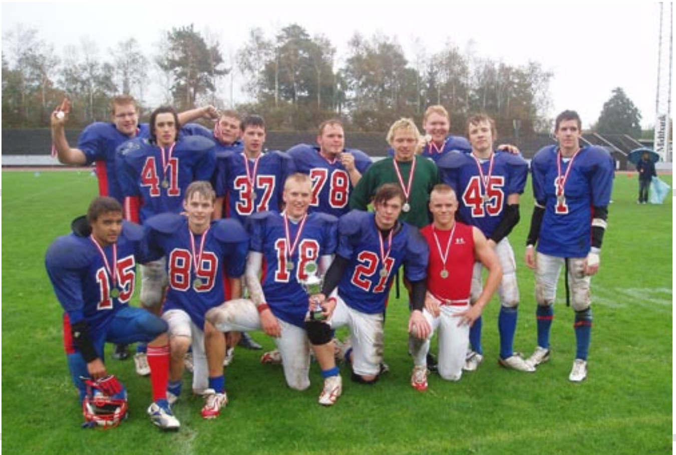
Et stolt U19 hold med sølvmedalje efter en flot 2007 sæson